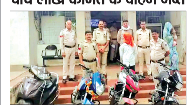
विदिशा। चोर गिरोह के अन्य चोरी की घटनाओं में शामिल होने की आशंका है।