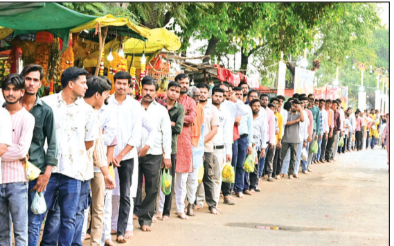
परिसर में कालीन बिछाए गए और छाया तथा पेयजल की विशेष व्यवस्था की गई। इसके अलावा बहारा बाबा घाट पर भी दिनभर भंडारा चलता रहा। महलघाट और

इस अद्भुत दृश्य को देखने के लिए बड़ी संख्या में श्रद्धालु पहुंचे। भक्तों की सुविधा के लिए दोपहर से देर रात तक भंडारे का आयोजन हुआ। भीषण गर्मी को देखते हुए मंदिर