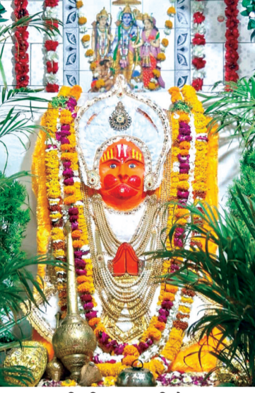
हरिभूमि न्यूज ॥ सिरोंज

से चल समारोह की अगुवानी बैड, डीजे सहित ढोल ढमाकों के बीच शुरू की गई। इस दौरान भक्त अपने हाथों में भगवा ध्वजा लेकर भक्तों की धुन पर थिरकते हुए जय श्रीराम के नारे लगाते हुए चल रहे थे। यह चल समारोह नगर के कस्टम पथ, कटाली बाजार, कपड़ा बाजार, चांदनी चौक, कोर्ट रोड, राज बाजार से होते हुए मंशपूर्ण हनुमान मंदिर पहुंचा जहाँ पर मंदिर के शिखर पर ध्वजा अर्पण किया गया और आरती की गई इसके बाद यह चल समारोह पुनः वापिस होते हुए तहसील रोड, थाना, नया कार्यालय, बजारिया, हाजीपुर, सुभाष नगर से होते हुए इमलीनी रोड पर स्थित लाल बाबा हनुमान मंदिर पहुंचकर समापन किया गया। इस दौरान हजारों की संख्या में भक्तगण मौजूद रहे।