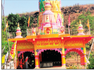
मंदिरों में सजावट और रामायण पाठ सहित विशाल भंडारे हुए