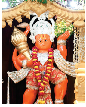
हरिभूमि न्यूज | विदिशा

जिले में हनुमान जन्मोत्सव का पर्व श्रद्धा और भक्ति के साथ मनाया गया। शहर और ग्रामीण क्षेत्रों के हनुमान मंदिरों में सुबह से ही 'जय श्रीराम' और 'बजरंगबली' के