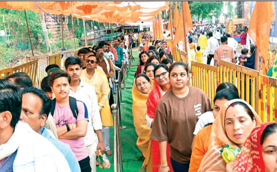
विदिशा। रंगई हनुमान मंदिर पर अल सुबह से ही भक्तों की लंबी कतार लगी रही। श्रद्धालुओं की सुविधा के लिए इस बार विशेष इंतजाम किए गए।

शहर के रंगई स्थित दादजी मनोकामनापूर्ण सिद्ध हनुमान मंदिर में इस वर्ष भव्य और अनूठी सजावट की गई थी। मंदिर को 'अंजनी लोक' का स्वरूप दिया गया, जिसमें भगवान हनुमान की बाल लीलाओं, पराक्रम और प्रभु श्रीराम के प्रति भक्ति के विभिन्न प्रसंगों को जीवंत रूप में दर्शाया गया। मंदिर परिसर को रामायण के 32 प्रसंगों और धनुषाकार लैंपों से सजाया गया था। इस बार अयोध्या की तर्ज पर एक विशेष आयोजन के लिए बैकॉक से एक पेरिस्कोप